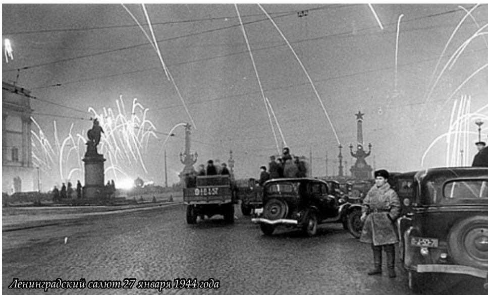
Ленинградский салют 27 января 1944 года

«Планы по захвату Ленинграда содержались уже в директиве № 21 от декабря 1940 года, более известной как план «Барбаросса», — рассказывает в беседе с «Лентой.ру» кандидат исторических наук Андрей Ратманов. — А в июле 1941 года, спустя месяц после нападения на СССР, Гитлер заявлял, что, в отличие от Ленинграда, Москва для него — всего лишь географический объект. В своих дневниках Гитлер писал, что для захватчиков предпочтительнее сравнять Ленинград с землей, в противном случае Германия придется кормить его жителей в течение зимы.