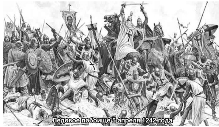
Ледовое побоище 5 апреля 1242 года

Оно произошло на льду Чудского озера, у Вороньего камня 5 апреля 1242 и вошло в историю как Ледовое побоище. Немецкие рыцари были разгромлены. Ливонский орден был поставлен перед необходимостью заключить мир, по которому крестоносцы отказывались от притязаний на русские земли, а также передавали часть Латгалии.